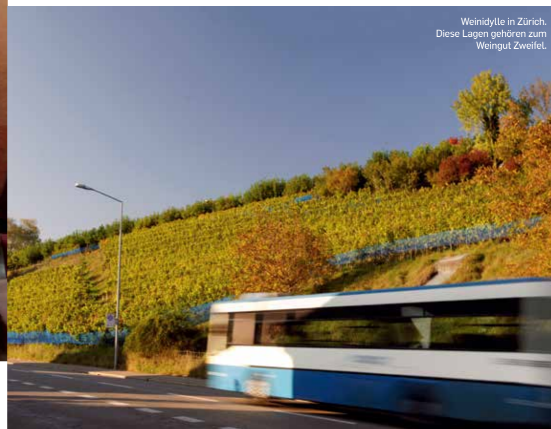
Weinidylle in Zürich. Diese Lagen gehören zum Weingut Zweifel.